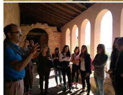
Viaje a una España desconocida