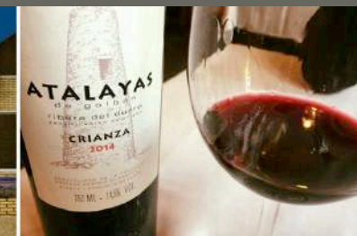
Lengua, arte, poesía y vino en Soria